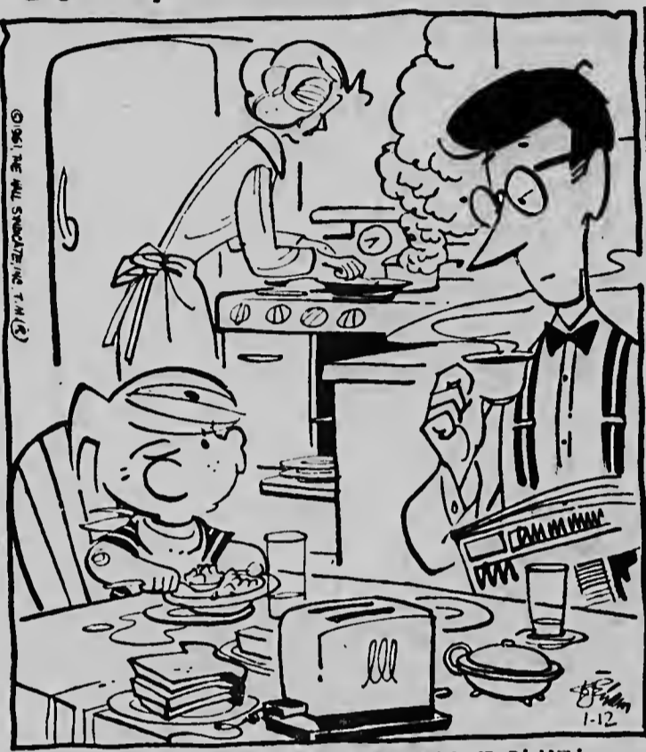
„Jongen, jongen. Wat heb ik een druk programma voor vandaag!” „Mi amigu! Mi tin un programa masha ocupa awe!”